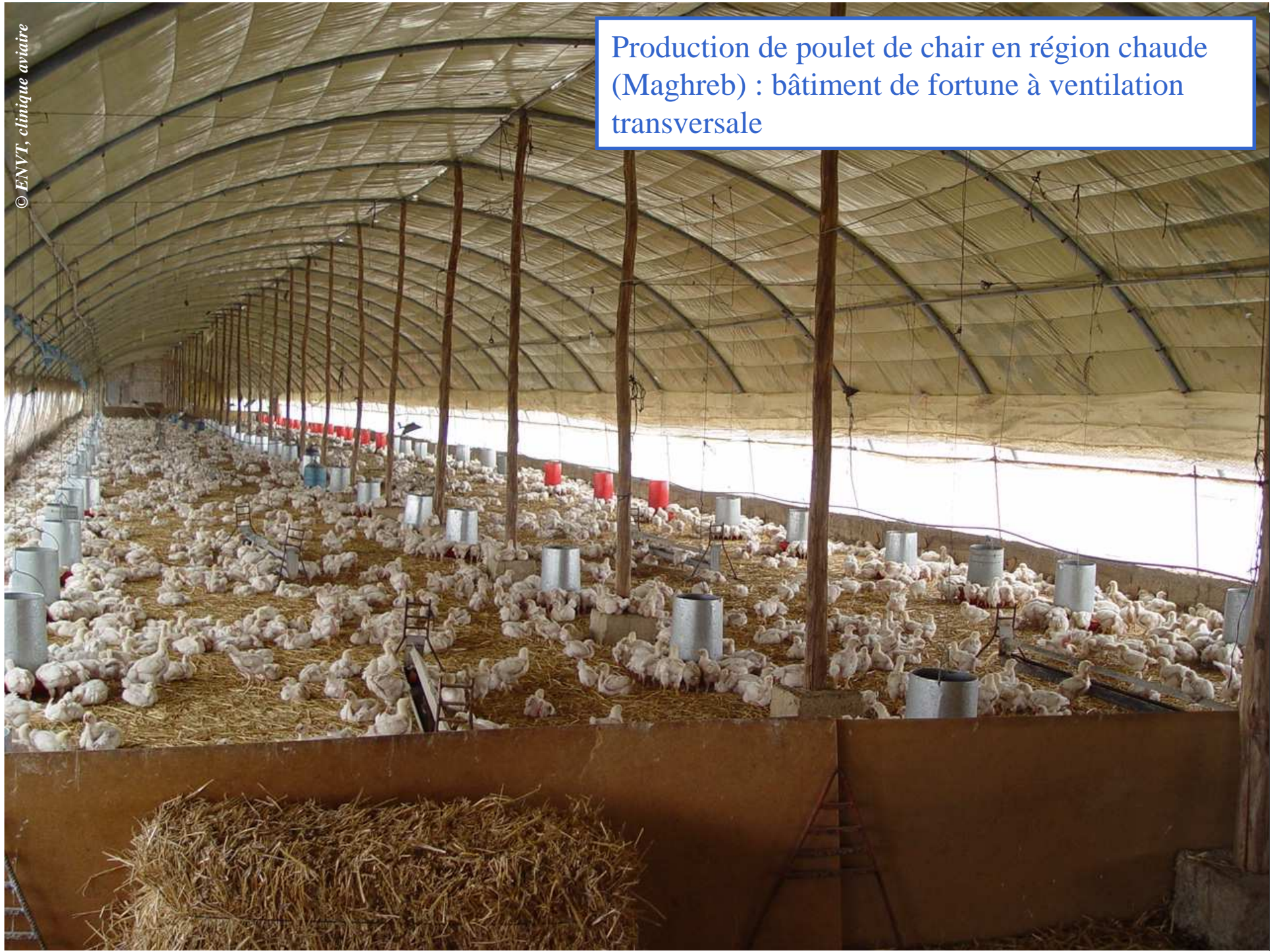
Production de poulet de chair en région chaude (Maghreb) : bâtiment de fortune à ventilation transversale