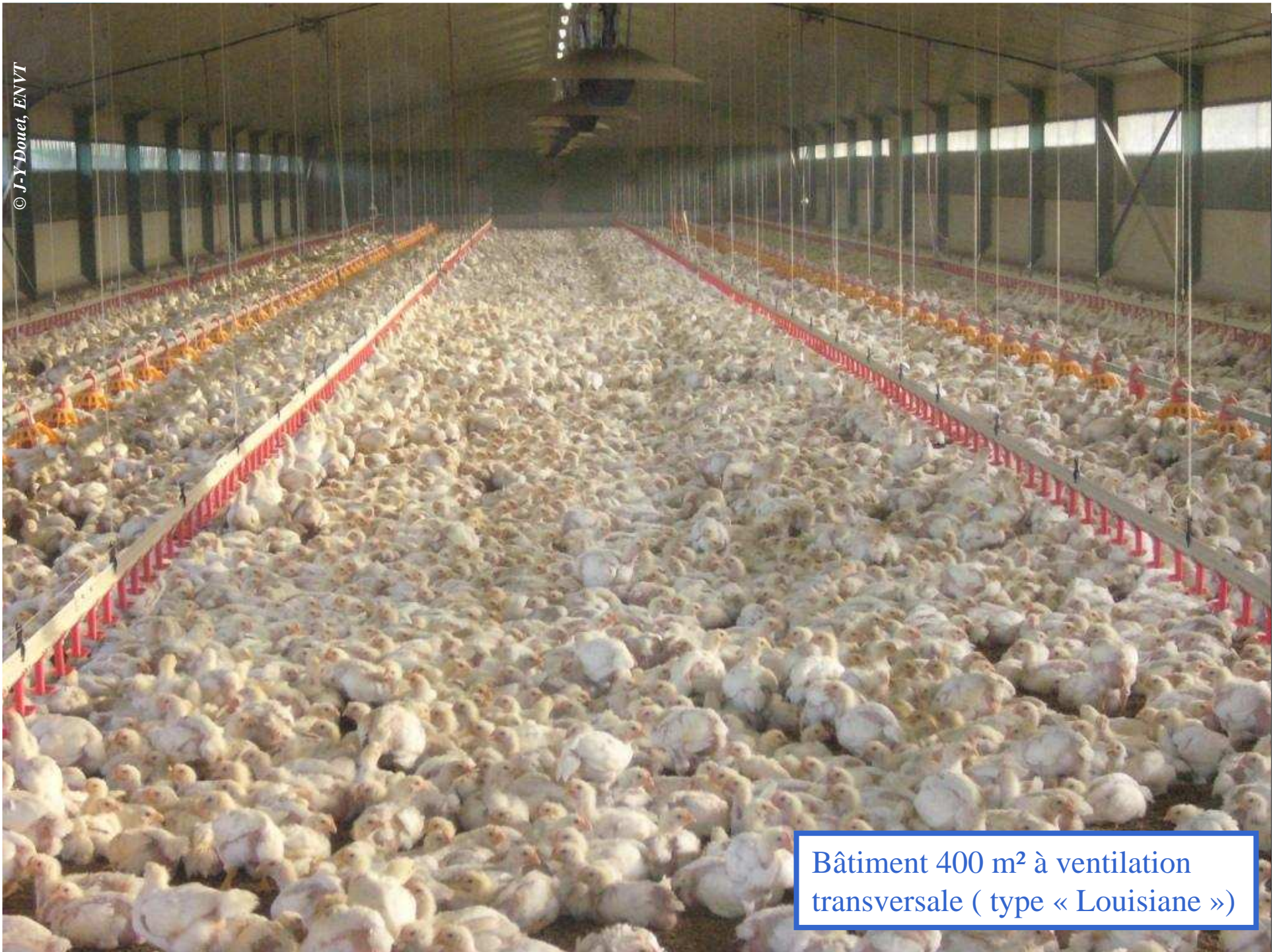
Bâtiment 400 m 2 à ventilation transversale ( type « Louisiane »)